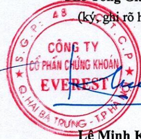
Lê Minh Khuê